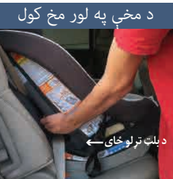
د مخې په لور مخ کول