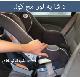
د شا په لور مخ کول

• سیت باید د بلټ تړلو په ځای کې له یو اړخ څخه بل اړخ ته له یو انچ څخه زیات حرکت ونکړي.