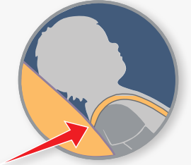
د شا په لور مخ کول

د مخې په لور مخ کول: د ځان تړلو پټې په اوږه يا له هغې څخه پورته ځای په ځای کړئ.