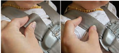
په گوتو کې راتولیدل

• د ځان تړلو (سینې تړلو) پټې غوټه د تخرګ د سطحې په اندازه ځای په ځای کړئ.